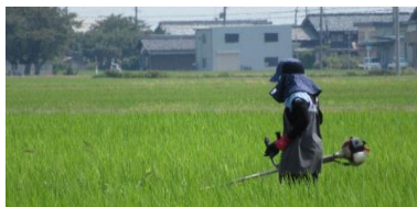
除草作業も連日頑張っています

7月、8月は暑い日が続きました。 土がカラカラになって稲が枯れないように、しっかりと水管理をしました！